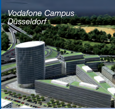
Vodafone Campus Düsseldorf