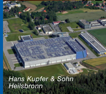
Hans Kupfer & Sohn Heilsbronn