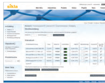
Sikla e-Shop : mit Netto-Einkaufspreisen, Verfügbarkeitsanzeige, Auftragsverfolgung und Datenormdownload

Electronic-Billing : Auf Wunsch versenden wir auch elektronische Rechnungen.