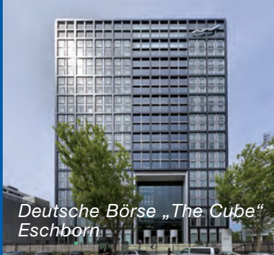
Deutsche Börse „The Cube“ Eschborn