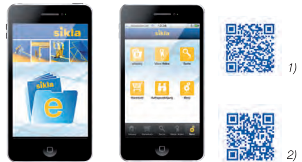
Die Sikla App : der Online-Shop für unterwegs. Verfügbar für iPhone 1) und Android 2)

Sikla Kunden können sich unter www.sikla.de registrieren.