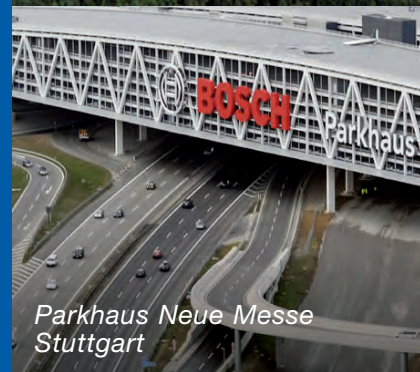
Parkhaus Neue Messe Stuttgart