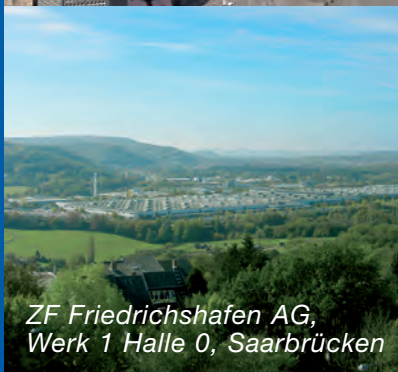
ZF Friedrichshafen AG, Werk 1 Halle 0, Saarbrücken