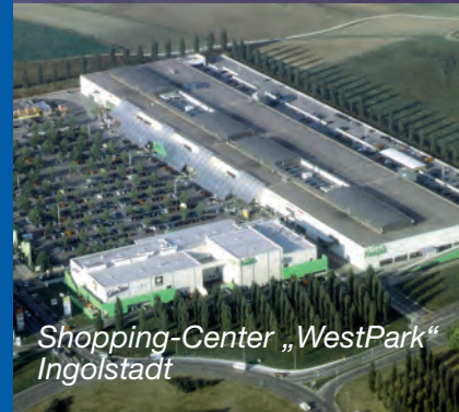
Shopping-Center „WestPark“ Ingolstadt